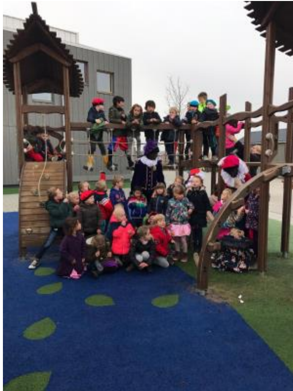
1 - De Pieten vonden het heel gezellig om met de kinderen van De Boxem buiten te spelen.