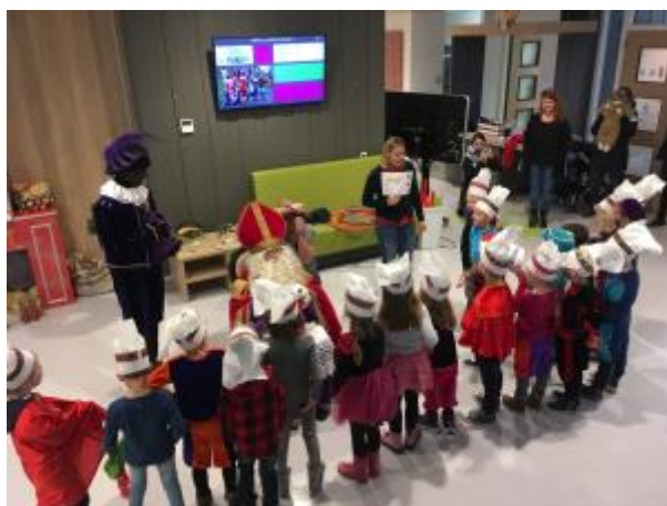
3 - Een muziekvoorstelling, dansje, liedje en een versje voor de Sint!

Sinterklaas heeft erg genoten van de stukjes die de kinderen hebben opgevoerd!