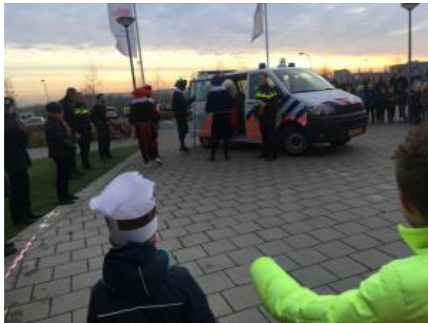
2 - De agenten kwamen Sinterklaas onderweg tegen. Amerigo was heel moe en kon niet meer verder, dat zagen de agenten die in de politiebuis door de wijk reden. Gelukkig kon Sinterklaas door de agenten naar school gebracht voor het feest.